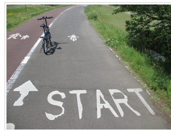
Jeep JE-206G Navy ポタリ ング 2016・5/11～