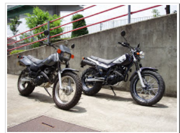
TW200 97・7/6～72000km & TW225E 20thAnniv 07・6/21～83000km