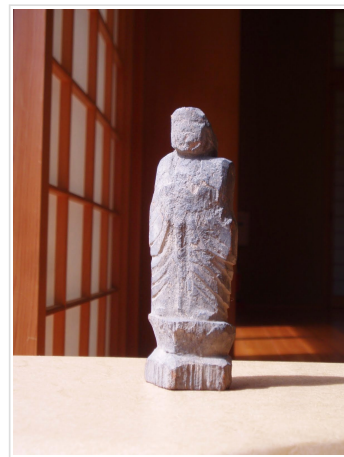
2014(平成26)年 秋 発見(確認)